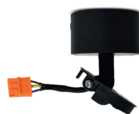
Réf : 100222 En saillie