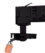
Réf : 100220 Fixation rail