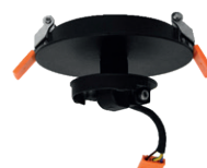
Réf : 100221 Encastré