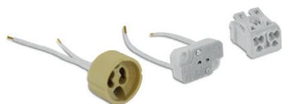
Culot GU10 / GU5.3