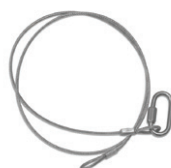
Fillin de sécurité x2