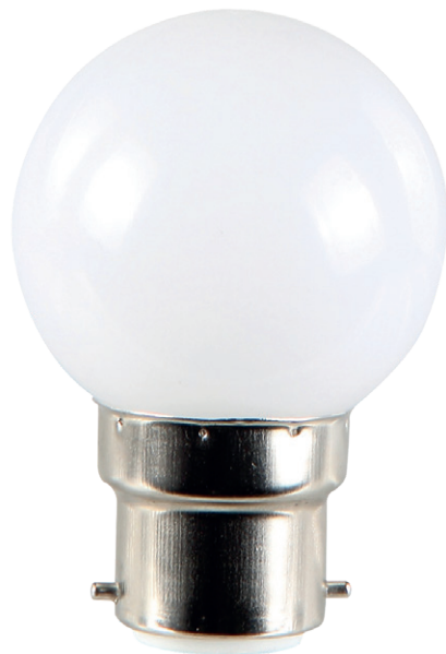
Ampoules incassables (globe en polycarbonate)