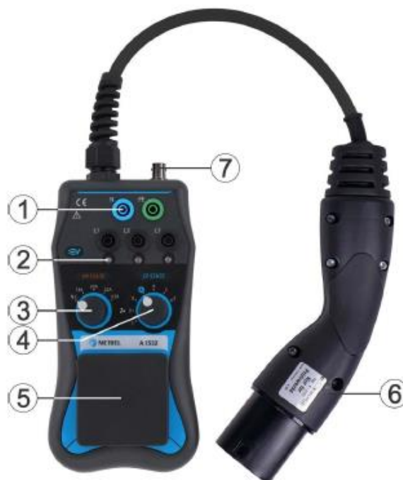
Illustration 3.1: Composants