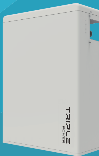
HV1150 V2 (Esclave)