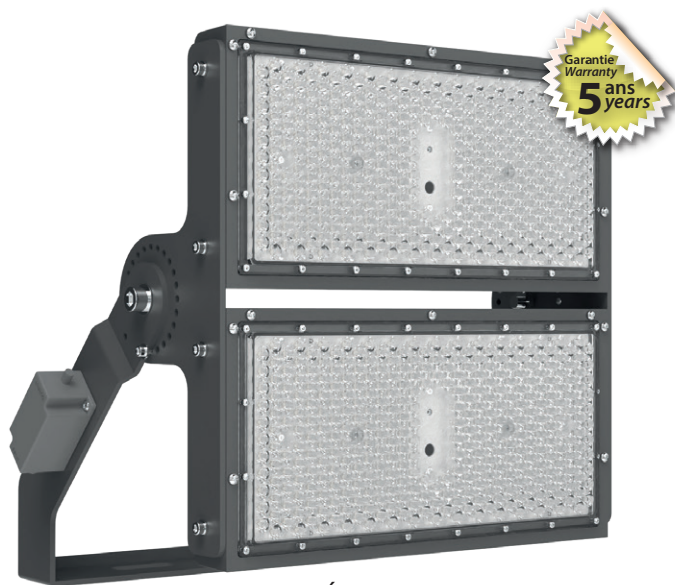
Équipé d'un SPD 20 KV